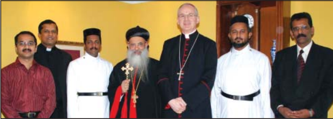
ശ്രേഷ്ഠ നിയുക്ത കാതോലിക്കാ ബാവാ വത്തിക്കാൻ എംബസിയിൽ

കുവൈറ്റ്: കുവൈറ്റിൽ ഔദ്യോഗിക സന്ദർശനം എത്തിയ ശ്രേഷ്ഠനിയുക്ത കാതോലിക്കാ ബാവാ വത്തിക്കാൻ അംബാസഡറെ കേരളത്തിലേയ്ക്ക് ക്ഷണിച്ചു. ഭാരതീയ സംസ്കാരത്തെയും, മലങ്കര ഓർത്തഡോക്സ് സഭയുടെ പൈതൃകത്തെയും മനസ്സിലാക്കുവാനും കേരള സന്ദർശനം പര്യാപ്തമാകുമെന്നും, കത്തോലിക്കാ സഭയും, ഓർത്തഡോക്സ് സഭയും തമ്മിൽ സഹകരണം വർദ്ധിപ്പിക്കുവാൻ ഇത് കാരണമാകുമെന്നും അദ്ദേഹം പറഞ്ഞു.