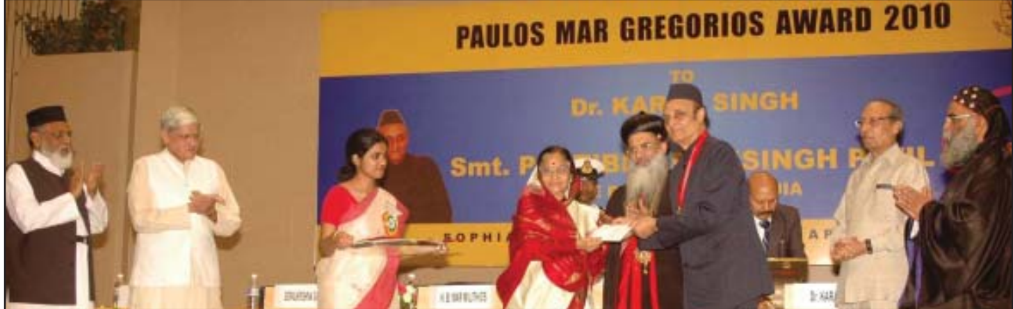
നൂറുവർഷം: ഒരു മതവും തീവ്രവാദത്തെ പ്രോത്സാഹിപ്പിക്കുന്നില്ലെന്നും മതാന്തര സംവാദത്തെ പ്രോത്സാഹിപ്പിക്കേണ്ട സമയമാണിതെന്നും രാഷ്ട്രപതി പ്രതിഭാപാട്ടിൽ പറഞ്ഞു. വിശ്വവിഖ്യാതനായ ഡോ. പൗലോസ് മാർ ഗ്രിഗോറിയോസ് മെത്രാപ്പോലീത്താ