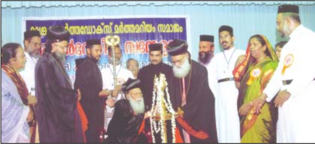
പാവ്യാടി: ഈ ലോക ജീവിതത്തിൽ നേരിടുന്ന കഷ്ടതകളും പ്രയാസങ്ങളും ദൈവം അറിഞ്ഞു നൽകുന്നതാണെന്നും, പ്രശ്നങ്ങളിൽ നിന്നും പിന്തിരിഞ്ഞാടാതെ അത് ധൈര്യമായി നേരിടുവാൻ തയ്യാറാ