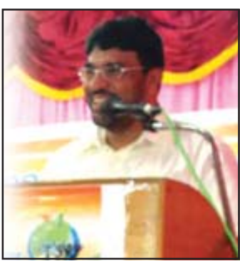
ജൂബിലി ആഘോഷങ്ങളുടെ ഉദ്ഘാടനവും തിരുമേനി നിർവ്വഹിച്ചു.